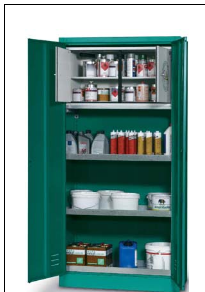
Armarí per a fitosanitaris, amb departament per a líquids inflamables: 2 cubetes i departament amb tanca de seguretat automàtica