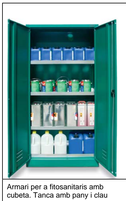
Armarí per a fitosanitaris amb cubeta. Tanca amb pany i clau